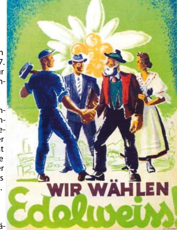
Einendes, patriotisches Symbol für Tirol

Das Edelweiß ist die Lieblingsblume sowohl Kaiser Franz Josephs und Kaiserin Elisabeths als auch von König Ludwig II von Bayern. In der Zeit des 1. und 2. Weltkriegs als auch im