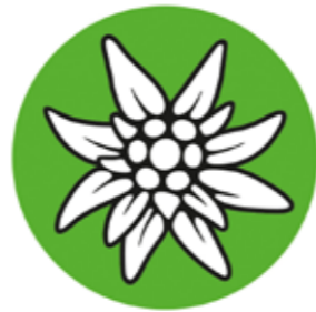
Offizielles Logo des ÖAV seit 2014

Zum Schutz vor einer maßlosen „Edelweiß-Industrie“ und vor einer sich abzeichnenden Ausrottungsgefahr steuert man mit Aufrufen und strengen Schutzmaßnahmen entgegen.