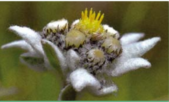
Zwittrige, gelbe Röhrenblüten

In den Hochblättern sitzen 2 bis 12 Blütenköpfchen mit einem Durchmesser von 5 -7 Millimetern, in denen sich 50 bis 500(!) winzige Blüten befinden. Jede dieser Blüten setzt sich wiederum aus 20 - 25 weißen, fadenförmigen, gezackten Borsten zusammen, die von gelblichen und trichterförmig zusammengewachsenen Blütenblättern umgeben sind. Im Inneren der Trichter sind nun